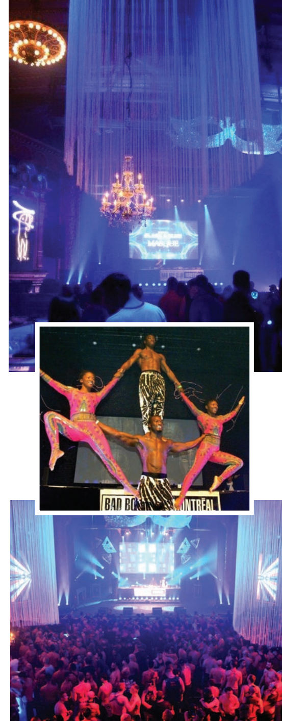
Crédit photos : Michel Bazinet photographe pour la Fondation BBCM, événement principal du Festival Black & Blue 2019.

Située au cœur de la Cité des arts du cirque, la TOHU est un lieu de diffusion, de création, d'expérimentation et de convergence entre culture, environnement et engagement communautaire. Elle est devenue, depuis sa création, en 2004 une référence en matière de développement durable par la culture.